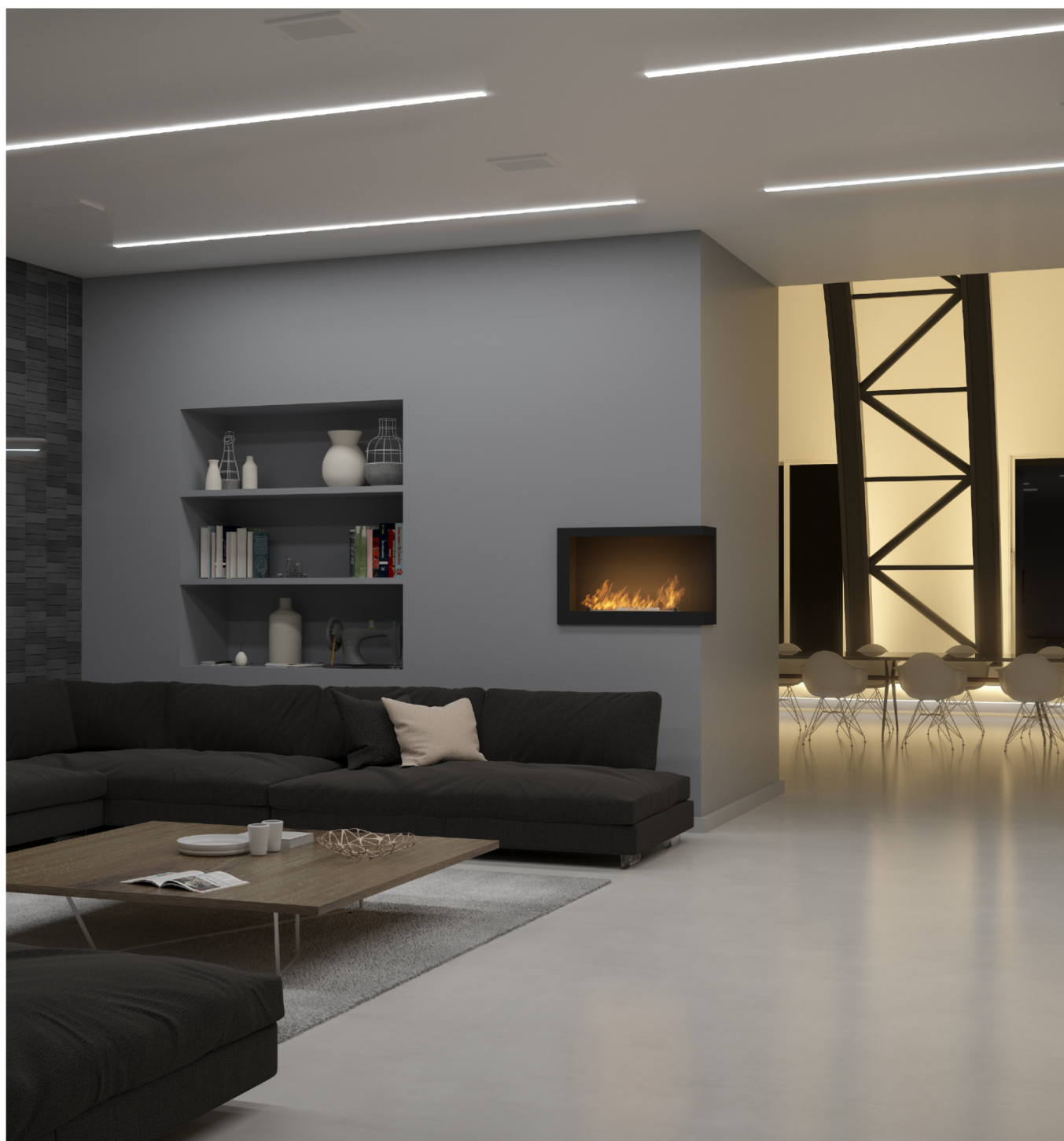
Biokominek Inside P800v1